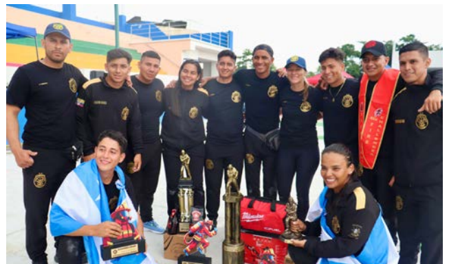
Primer lugar Grupal Mixto BCBG Rentados

Los competidores seleccionados por el Benemérito Cuerpo de Bomberos de Guayaquil para participar en el “Fire Challenger 2024” obtuvieron varias preseas en las distintas categorías que tenía el evento de habilidades bomberiles, desarrollado en la ciudad de Santo Domingo de los Tsáchilas, los días 22, 23 y 24 de marzo