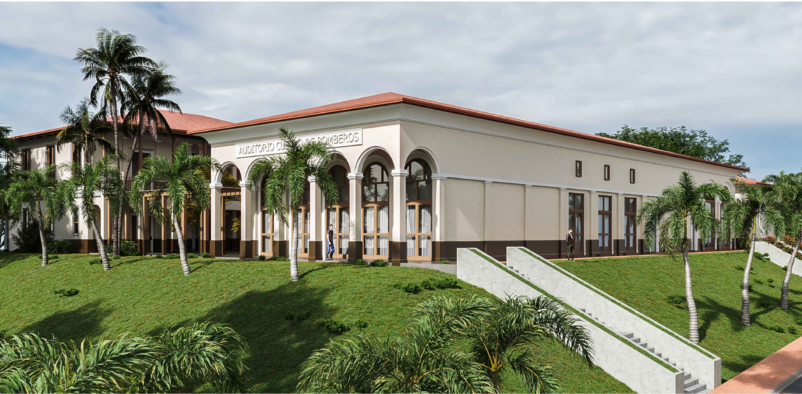
VISTA DESDE EL TALUD: BLOQUE 03 AUDITORIO, BLOQUE 04 AULAS