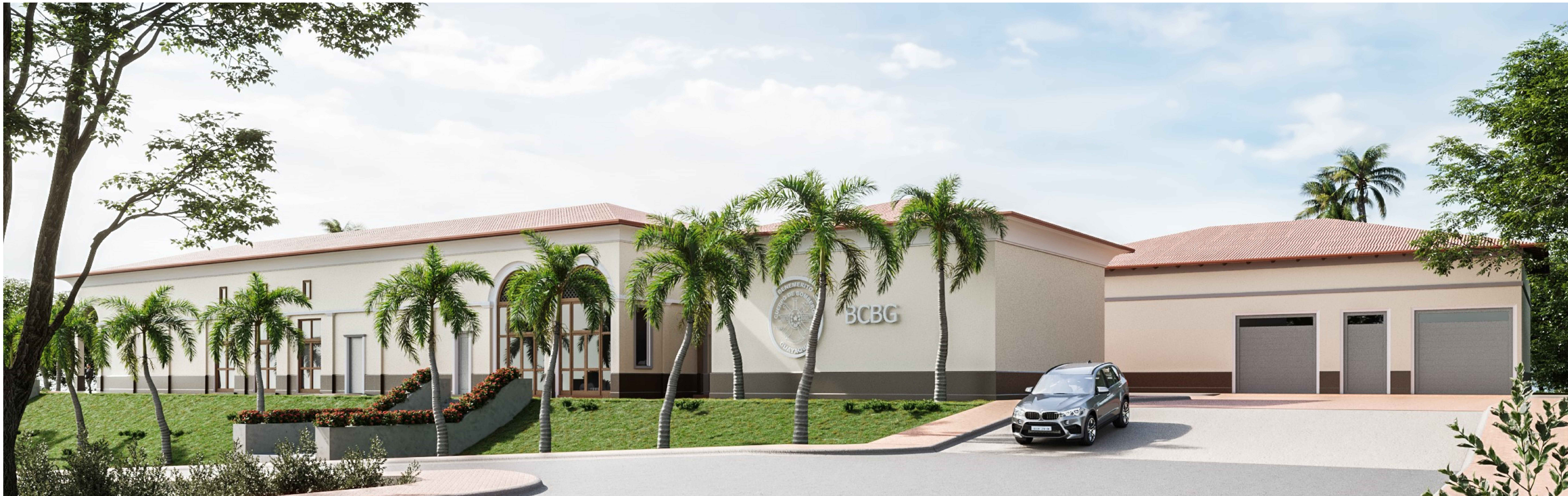
VISTA NORTE: ACCESO A RAMPA, LABERINTO. AUDITORIO, BODEGA