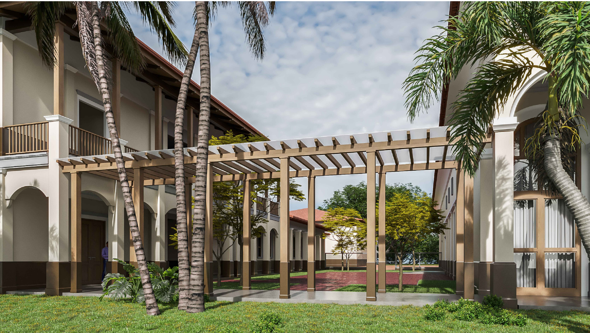
PERGOLA ENTRE BLOQUE 03- AUDITORIO Y BLOQUE 04 AULAS