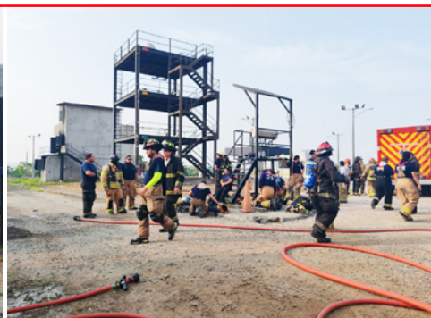
Prácticas en conjunto Cía. Sirena No. 4, Cía. Sucre No. 19 y Cía. Jefe Navarro No. 26.