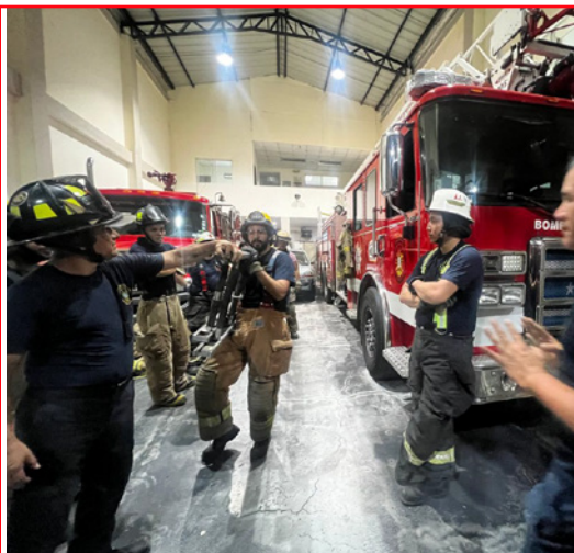
Prácticas Cía. Aspiazu No. 18.