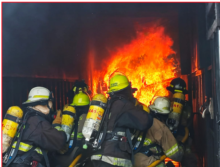
Prácticas Séptima Brigada y División Especializada Fluvial.